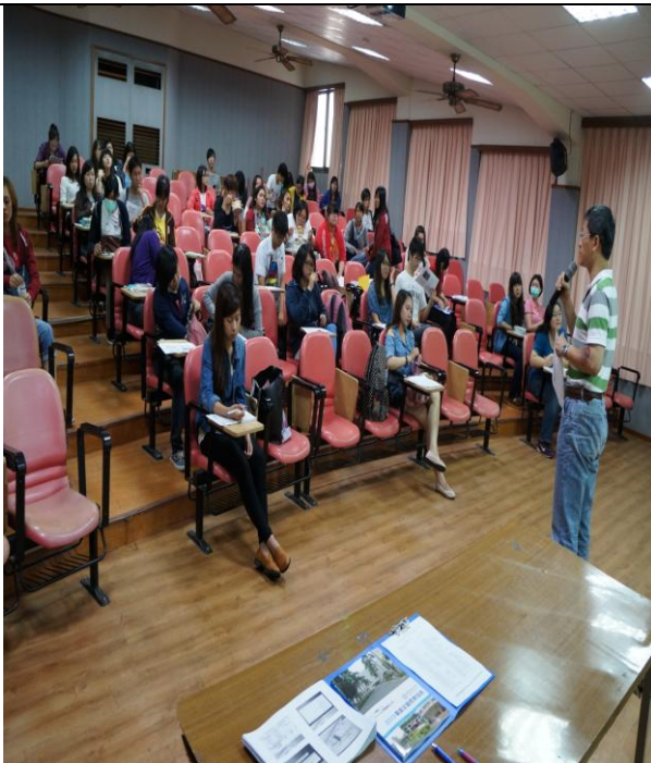
就業輔導組組長簡報 畢業生就業諮詢管道及各項就業求職輔導資訊