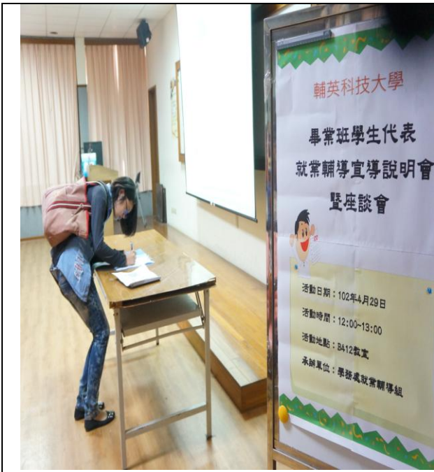
召開畢業班學生代表舉辦就業輔導說明會 學生報到領取畢業輔導手冊