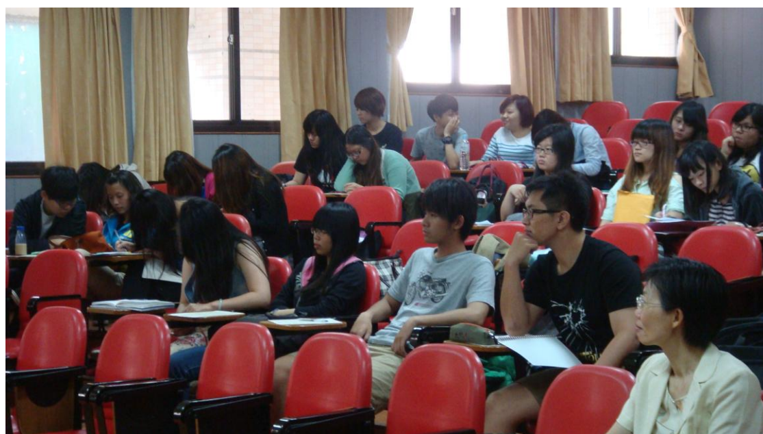
本學程師生聆聽蔡董事長演講情景