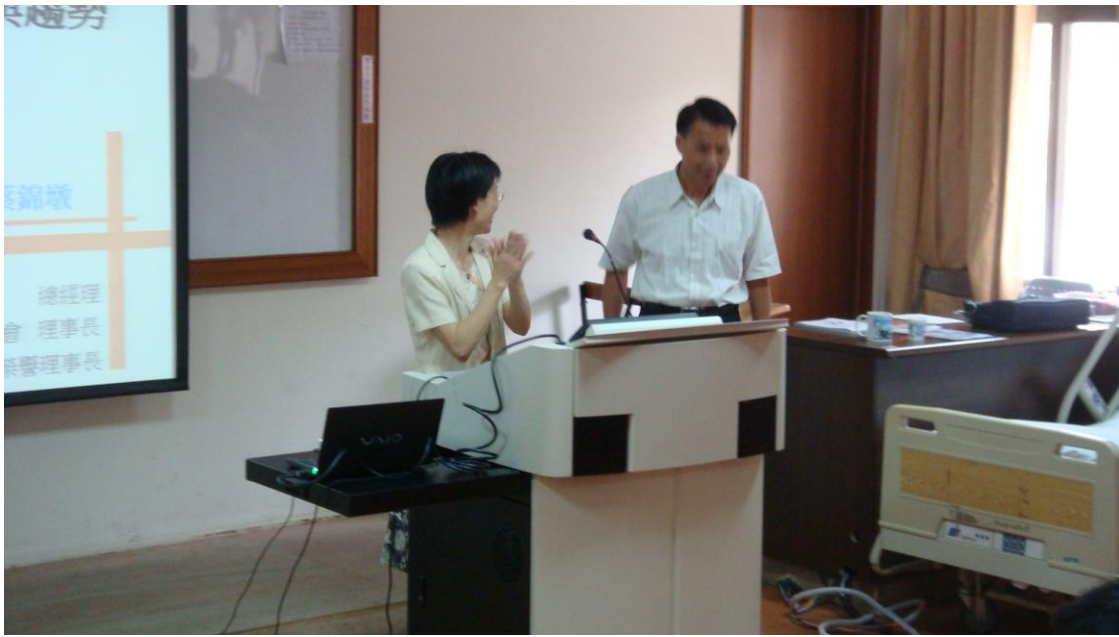
本學程宏蘭主任致歡迎詞暨介紹講者