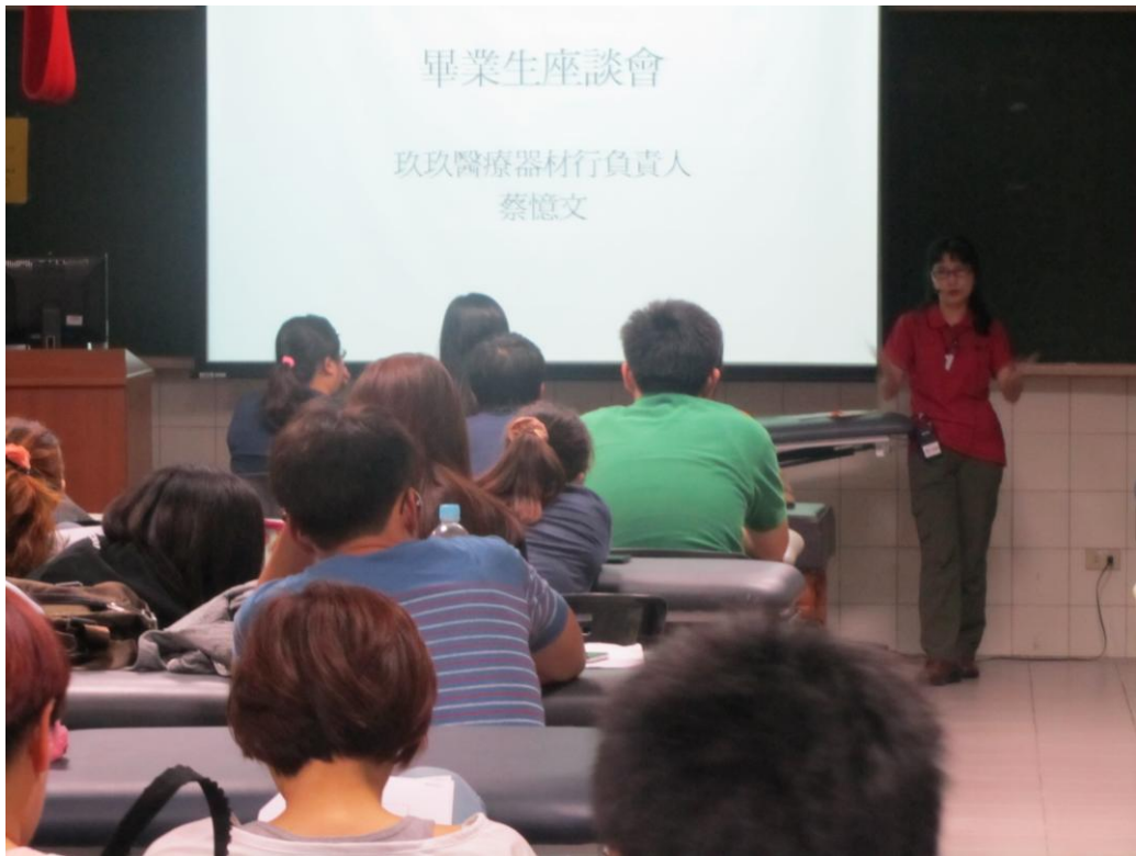
畢業座談活動情形