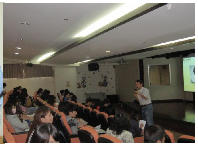
活動說明: 就業組劉組長致詞