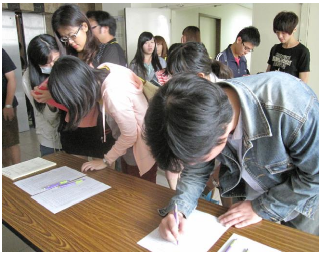
活動說明: 實際簽到情形