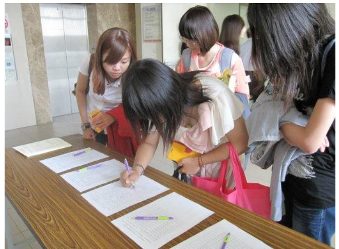
活動說明: 實際簽到情形