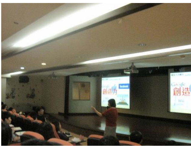
活動說明: 104 人力銀行于玲燕與同學談創造力