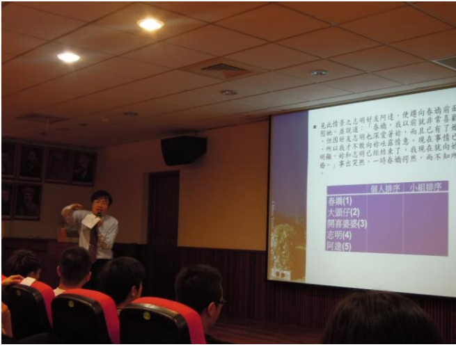
(春嬌與志明愛情故事)