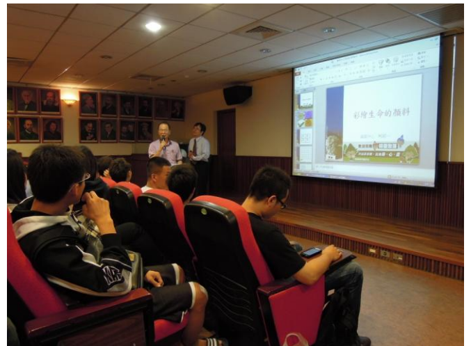
(老師與主講人互動情況)