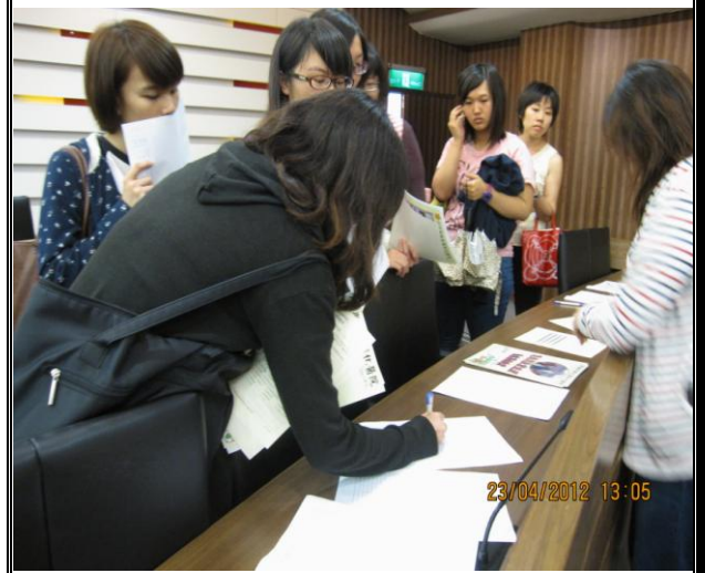
活動說明：活動開始同學簽到