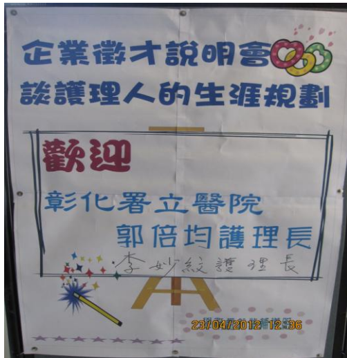
活動說明：實務性專題活動海報