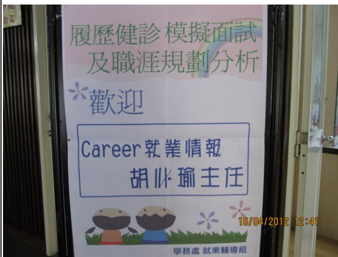
活動說明：活動海報