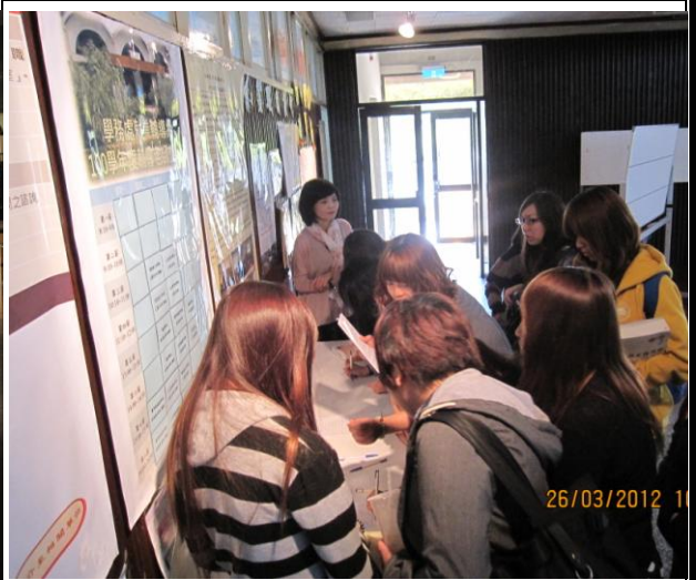
活動說明：活動開始同學簽到