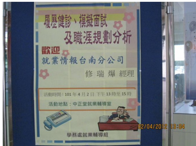
活動說明：活動海報