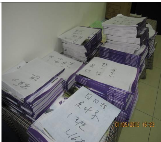
依班級發放的畢業手冊