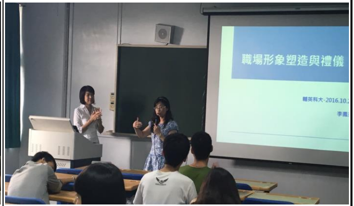
【插入圖片】 【結束:主持人表達謝意之詞】