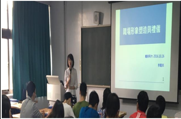
【插入圖片】 【尾場:學生與講者 Q&A】