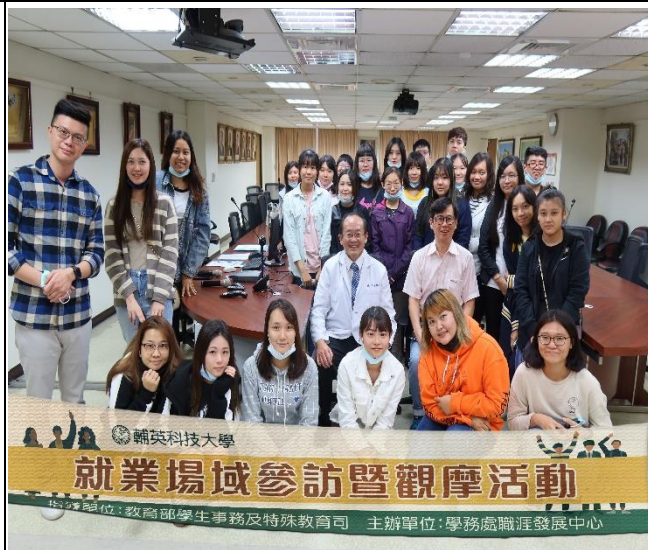
聯合醫院集體大合照