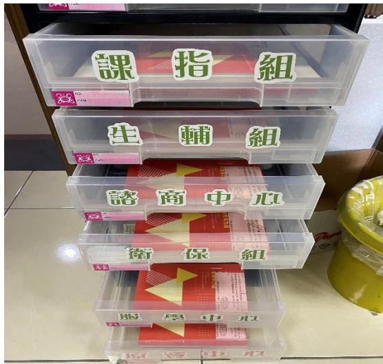
【於學務處各單位發放筆記書】