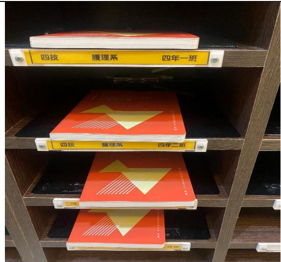
【於畢業班班櫃發放筆記書】