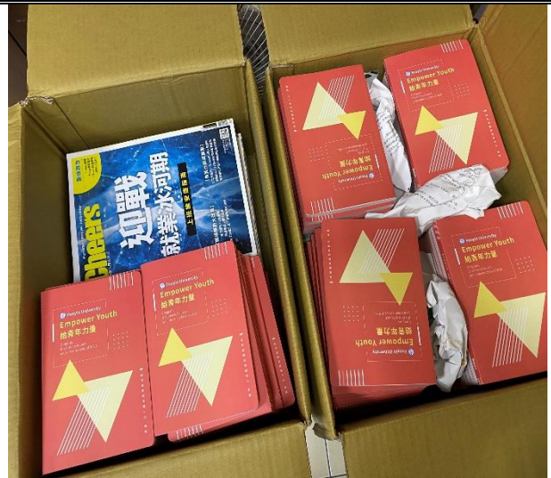
【2020校園客製化筆記書&2020求職專刊】