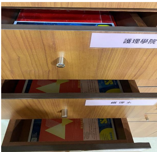
【於各院系公文櫃發放筆記書】