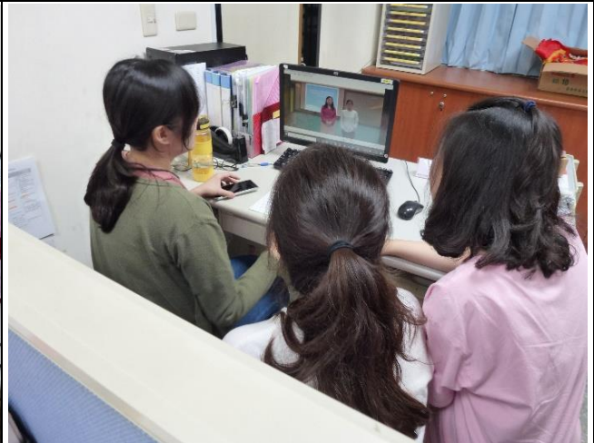
【學生於課餘時間觀看學姊經驗分享2】