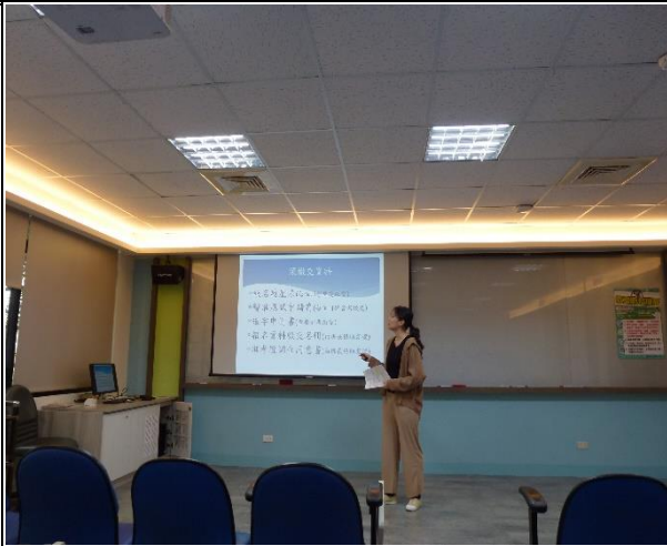
【講者與學生分享護理師考照準備方向2】