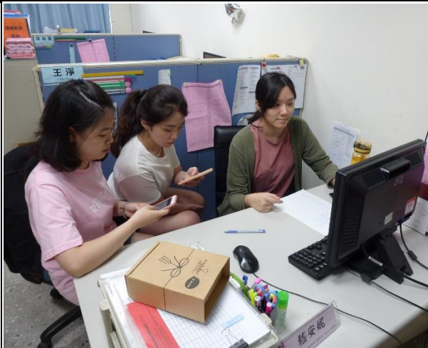
【學生於課餘時間觀看學姊經驗分享1】