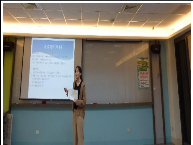
【講者與學生分享護理師考照準備方向3】