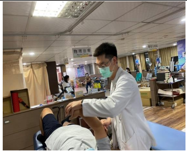
【觀察治療師治療病人】