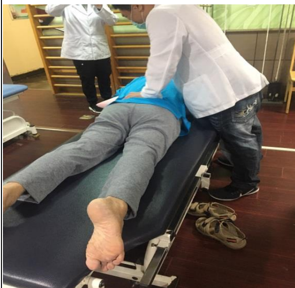
【治療師示範治療手法】