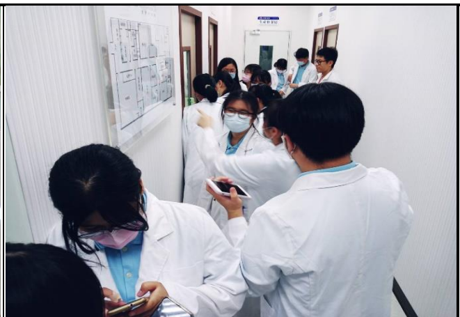
【學生參觀廠房結構圖】