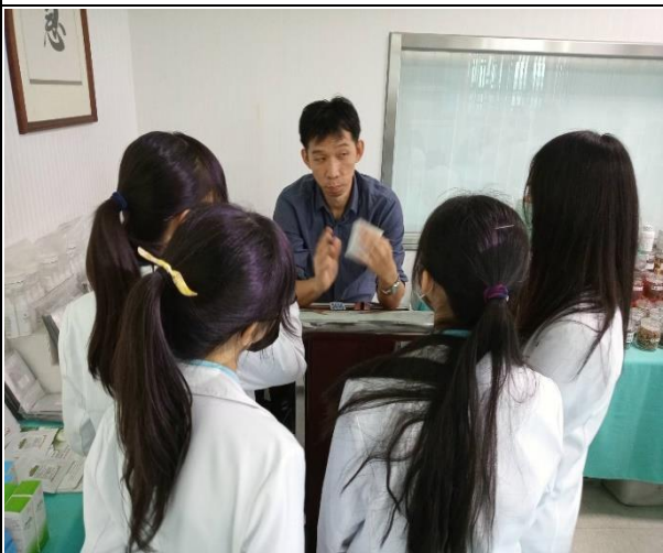
【陳廠長講解生物技術範疇，學生爭相學習】