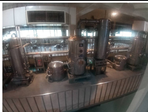
參觀中藥淬鍊設備