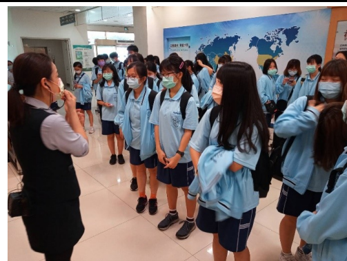
介紹牛樟芝的生態