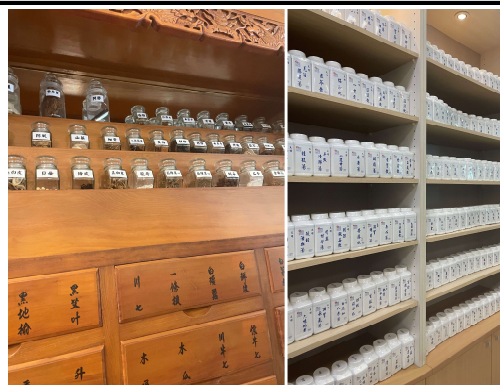
介紹傳統中藥材與科學中藥