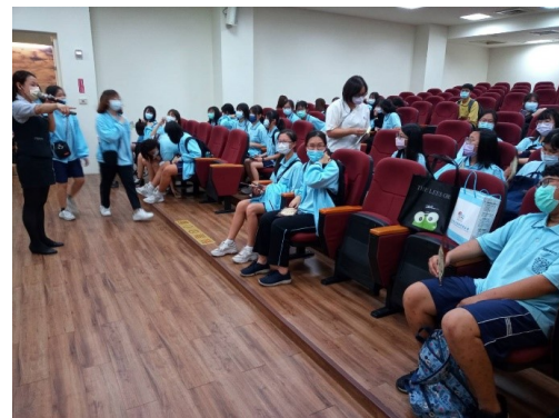
講師與學生互動踴躍