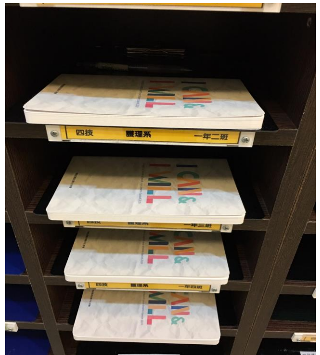
【於各學系班櫃發放筆記書】