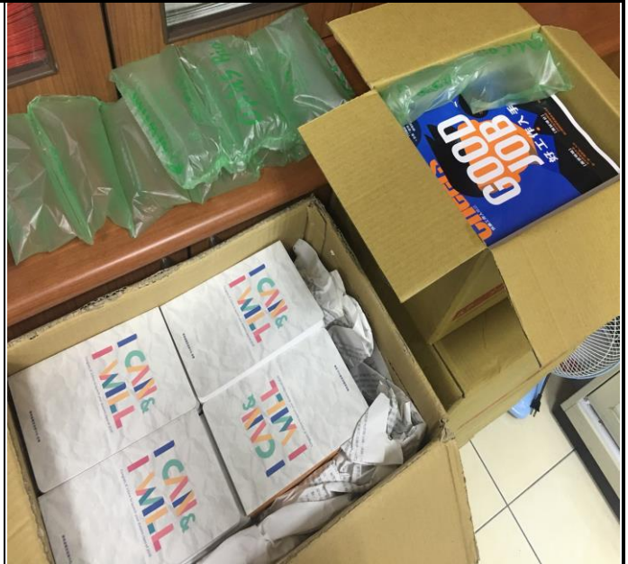
【2019 校園客製化筆記書&2019 求職專刊】