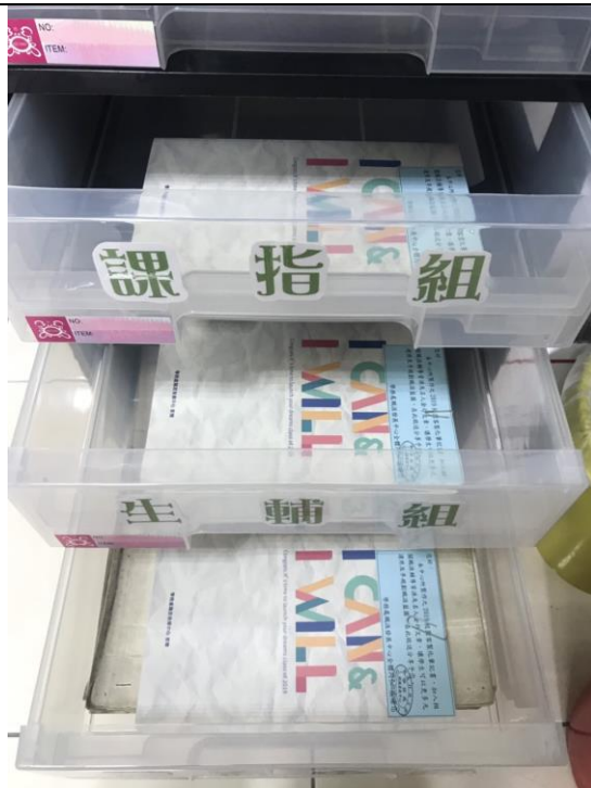
【於學務處各單位發放筆記書】