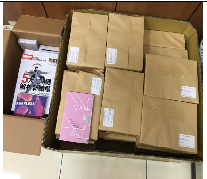
【2018 校園客製化筆記書&2018 求職專刊】