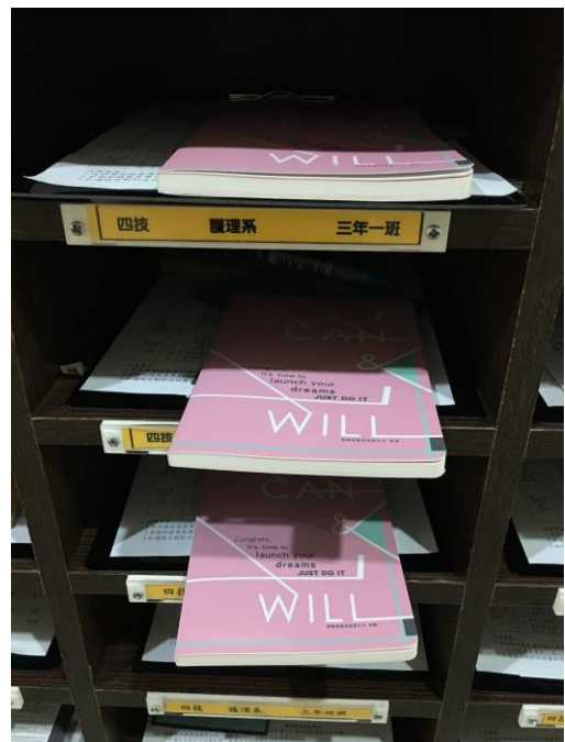
【於各學系班櫃發放筆記書】