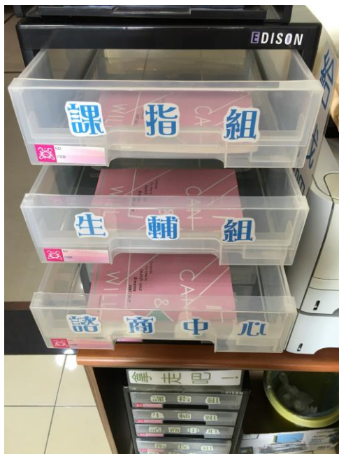
【於學務處各單位發放筆記書】