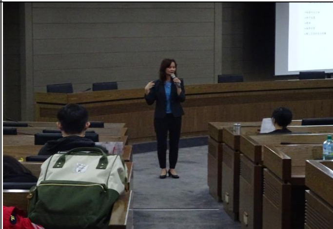
【張協理示範站姿儀態】