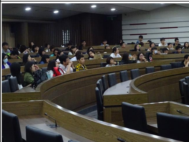
【學生認真參與活動】