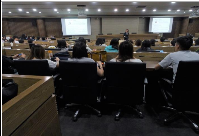
【張協理分享如何經營自己的職涯路】