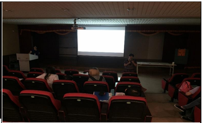
職場新鮮人面試須知