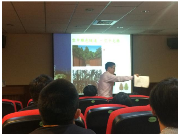
介紹溪頭遊樂區生態