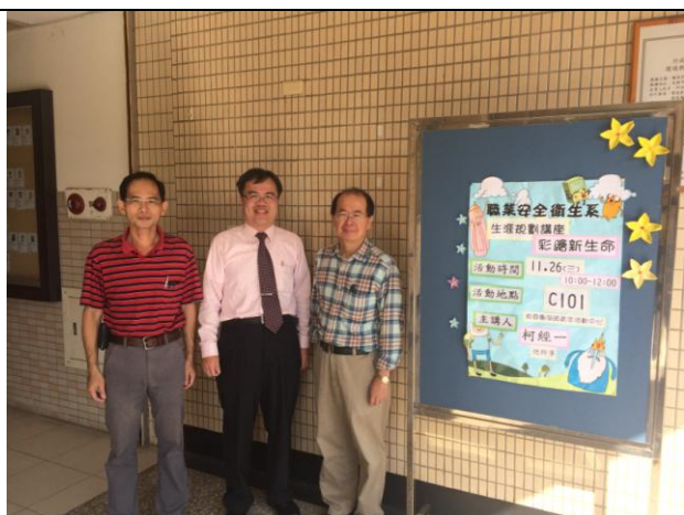
活動後講師與導師合影