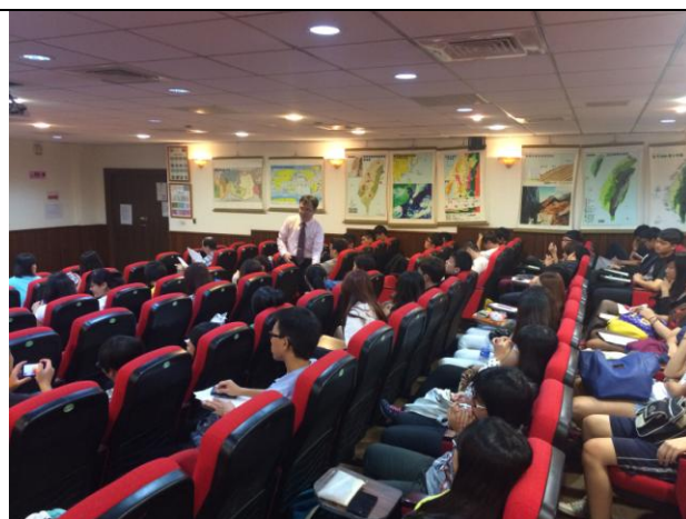
同學向講師發表問題