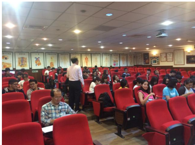
講師與同學互動情形