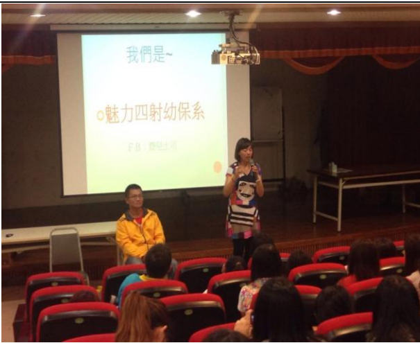
最後學生發表提問