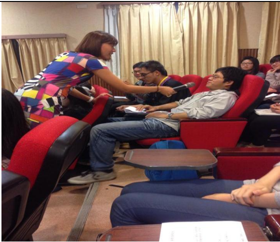
問與答，與學生互動